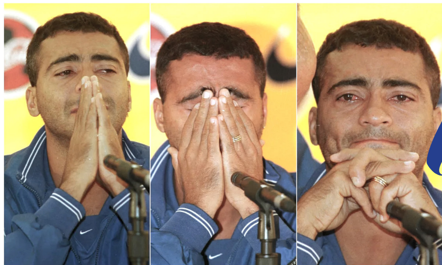
Para Francia 1998 el atacante de Brasil Romário se lesionó de gravedad y no fue tomado en cuenta por el director técnico Mário Zagallo y su asistente Zico, con los que había tenido problemas personales. Impactó verlo llorar ante las cámaras, explicando su ausencia.

También los sofismas de distracción, las cortinas de humo, los chamanes, las imposiciones. Llega la acción. La pelota sin discursos.